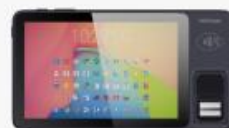
F600 FP Fingerprint Optical type Morpho CBM-E3, FBI