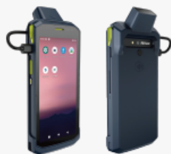
F310 With Back Clip Scanner