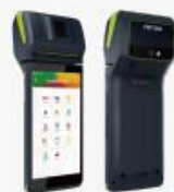
F20 FP Fingerprint