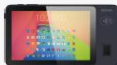
F600 FP Fingerprint Semiconductor capacitive type Aiatek A400-M, FBI / STOC